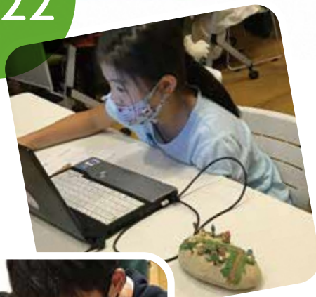
昨年の教室の様子

「森のねんど」で、自分だけのまち（ジオラマ）をつくろう！ 「森のねんど」は、木くずから生まれた環境にやさしいねんどです。 ねんどでつくったまちにLEDの電子回路を組み込み、 簡単なプログラミングを行うことで、灯りがつき、 温かいまちになります。