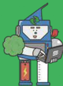
キャラクター名：やさぶろう

このイベントは「科学のまちの子どもたち」プロジェクト推進イベントです。「科学のまちの子どもたち」プロジェクトでは、未来を担う子どもたちに世界最先端の科学と文化が集積する学研都市にふさわしい学びの機会を提供する取り組みを行っています。