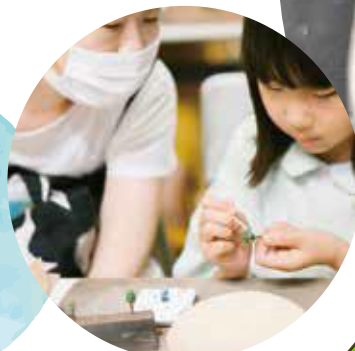
昨年の教室の様子